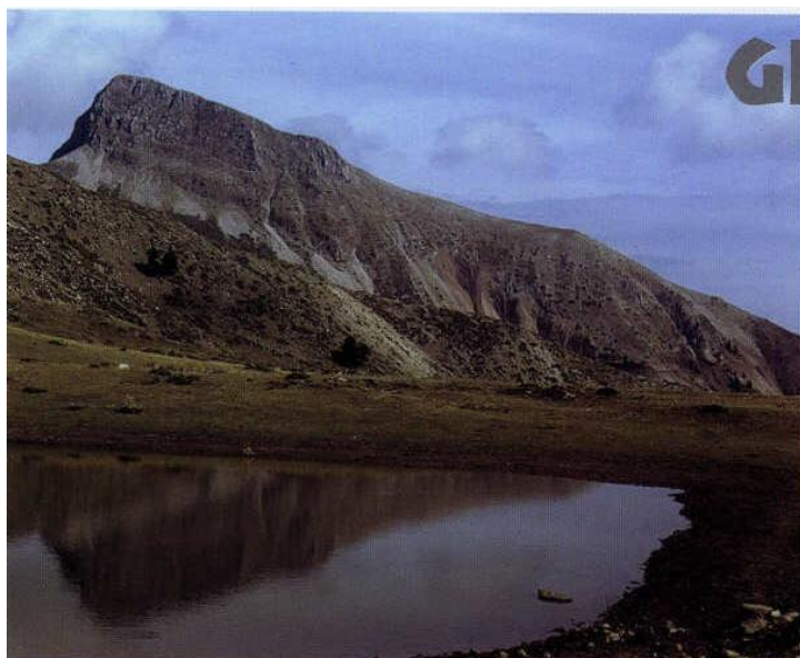
Agrafa-Gebiet: Svoni-Gipfel 2042 m